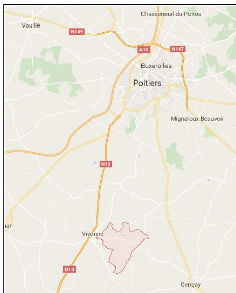
Localisation de la commune

La commune de Château-Larcher est située dans le département de la Vienne, à environ 25 km au sud de Poitiers. D'une superficie de 15,6 km 2 , elle comptait 995 habitants au 1 er janvier 2014. La commune dispose actuellement d'un plan local d'urbanisme approuvé le 7 juillet 2010.