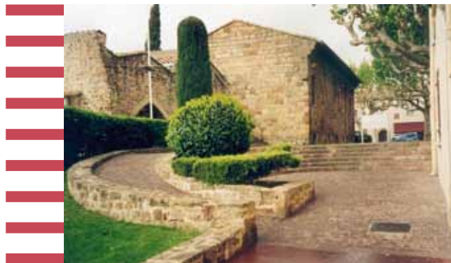
Exemple d'une intégration architecturale réussie d'une rampe d'accès dans un environnement préservé.

commun, volonté de créer des zones de rencontre ou de réduire la circulation automobile, demandes d'association, etc.).