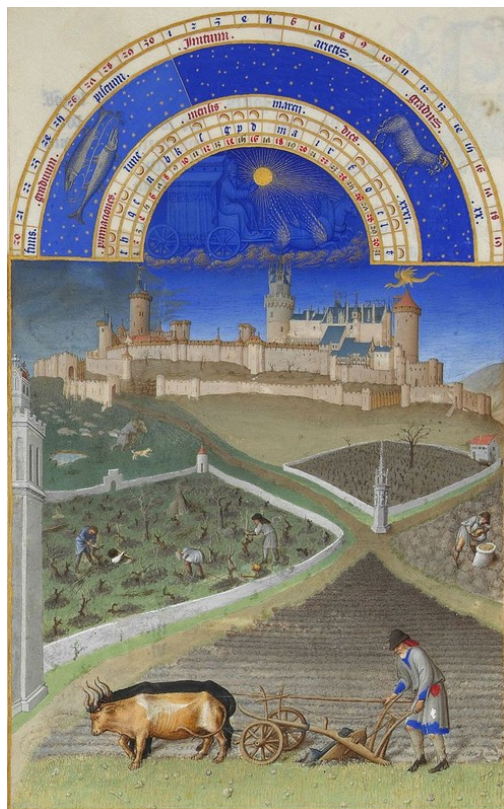
château de Lusignan Les Très Riches Heures du duc de Berri

De par son intérêt patrimonial historique, la promenade de Blossac aménagée au XVIIIème siècle par le Comte de Blossac, intendant du Poitou, sur la base de l'ancien château féodal, a été classé en 1935.