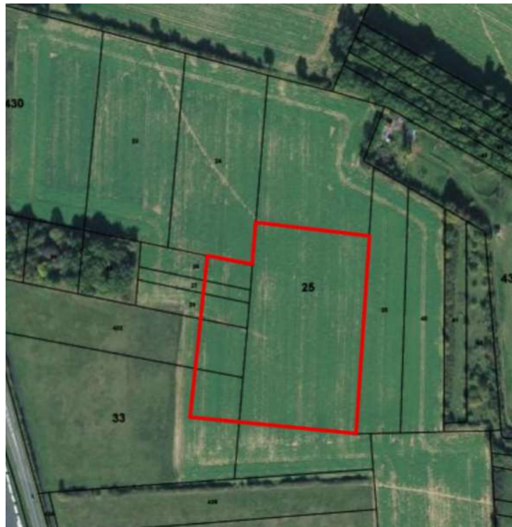
Figure 1 : Extrait du plan cadastral avec contour ICPE zonage rouge

L'emprise globale de la déchèterie, une fois construite, couvrira une superficie d'environ 13 932 m 2 sur les parcelles AM 25, 26, 27, 28, 33 et 432.