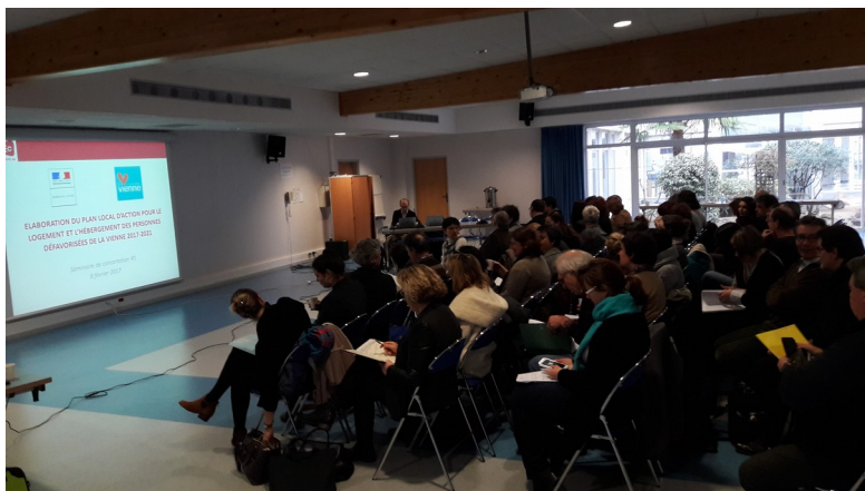
Le 8 février 2017, premier séminaire d'élaboration participatif du Plan qui a rassemblé près de 60 personnes

Débutés par l'évaluation du précédent Plan menée par des groupes de travail à l'automne 2016, les travaux de réflexion et les temps d'échange se sont poursuivis au 1 er trimestre 2017 avec l'assistance du bureau d'étude Enéis Conseil. Deux séminaires ont réuni plus de 50 structures partenaires les 8 février et 22 mars 2017.