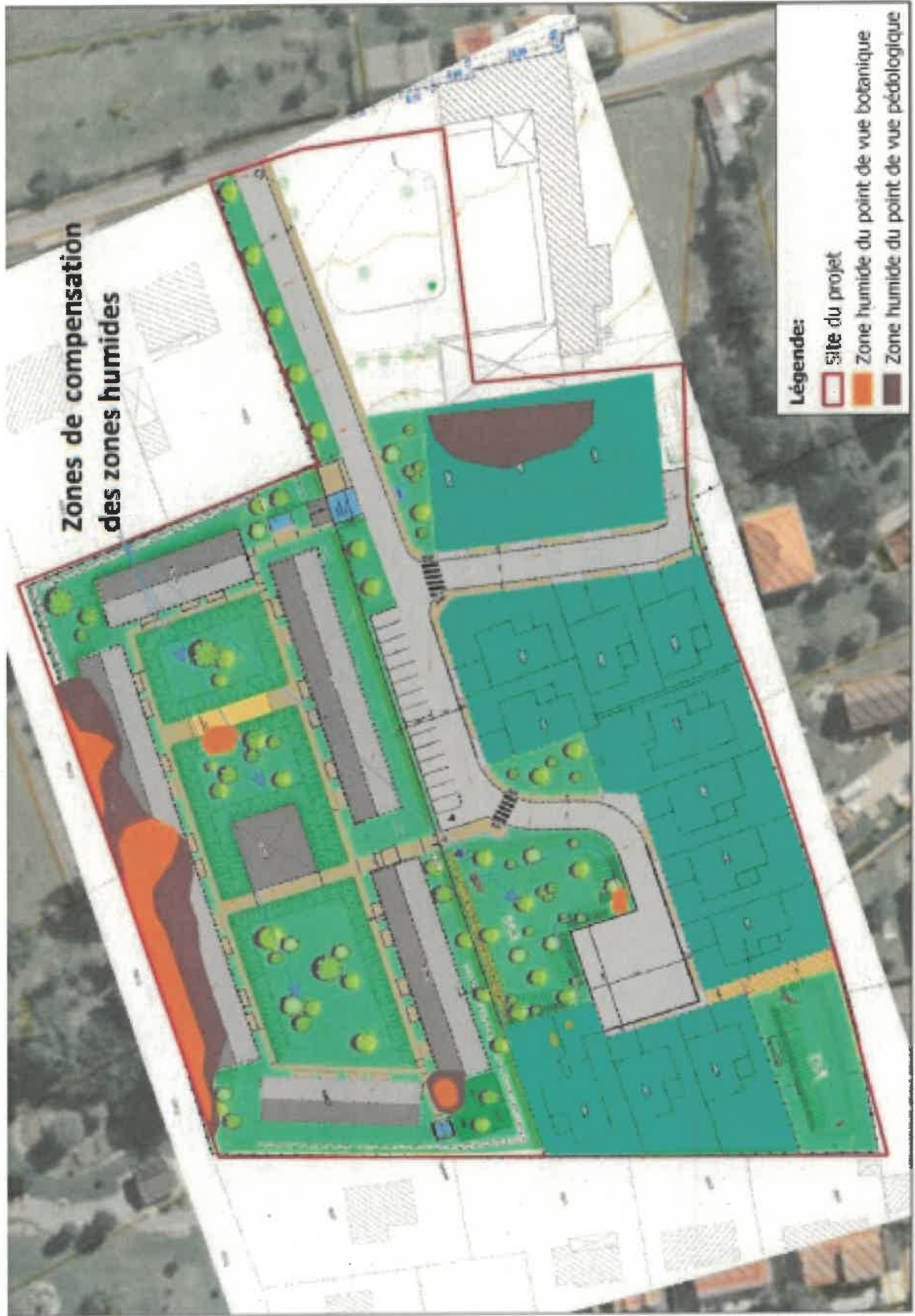
Carte 18 : Intersection du plan de masses avec les zones humides identifiées et mesures compensatoires,