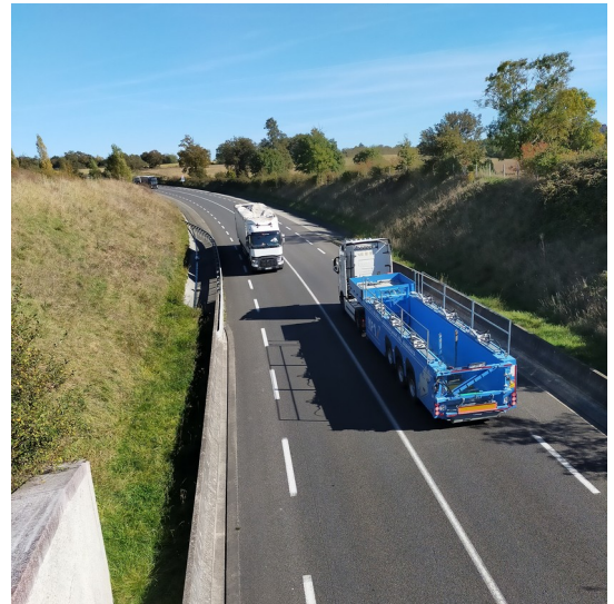
Déviation de Bellac

Mise en service en 2011. 2 x 2 voies sur 7,6 km.