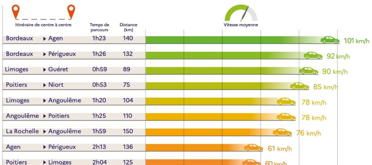
Temps de parcours de centre à centre entre diverses préfectures de Nouvelle-Aquitaine