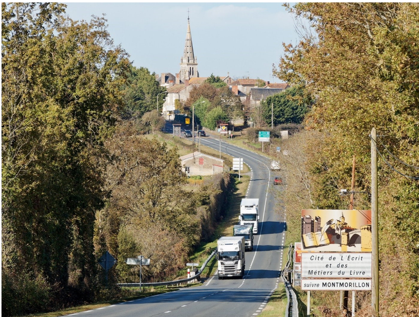
La RN147 dans l'entrée de Moulismes

Ces traversées de bourg sont à l'origine d'accidents et de ralentissements et source de nuisances pour les riverains. Pour autant, la RN147 peut aussi constituer un enjeu économique pour les commerces à destination des usagers (restaurants, stations-services...).