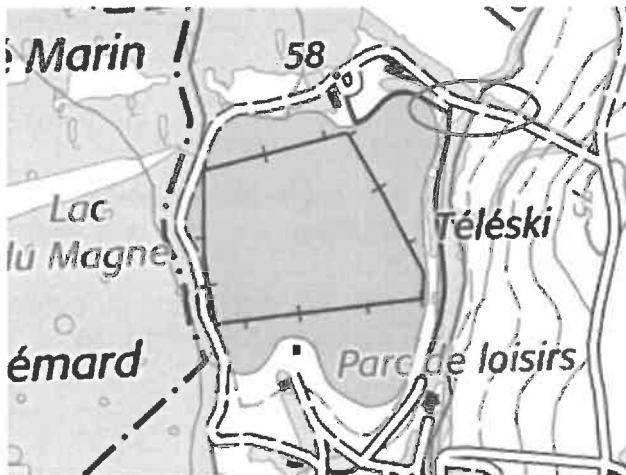
le clapet situé sur la Dive du Nord (1)